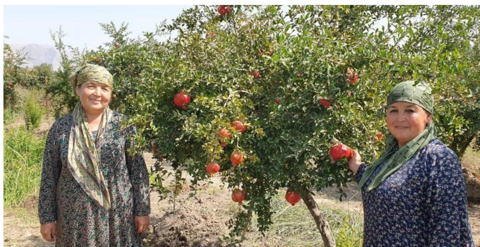
Foto: Kundinnen von Bailyk

MCC Bailyk Finance LLC ("Bailyk") ist ein Mikrofinanzinstitut aus Kirgistan. In dem gebirgigen Land mit wenigen Ballungsräumen fokussiert sich Bailyk auf ländliche und dörfliche Regionen beim Ausbau des eigenen Filialnetzes. In diesen unterversorgten Gebieten werden bezahlbare Kredit- und Finanzdienstleistungen angeboten, u.a. über neue und digitale Kanäle, um die Lebensqualität der Kund*innen zu verbessern.